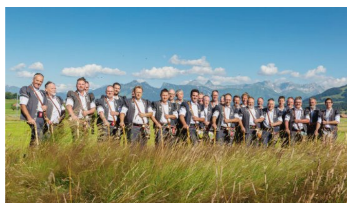
Le Chœur des Armaillis de la Gruyère, un des meilleurs chœurs d'hommes de Suisse romande.

Le répertoire du Chœur des Armaillis s'étend aussi à la musique religieuse catholique et orthodoxe, cette der-